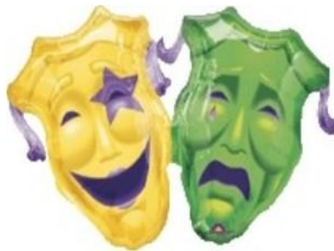
۷. ضد سایکوزها: