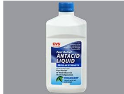
۳. آنتی اسیدها یا ملین های حاوی منیزیم:

پروکائین-لیدوکائین-بوپیروکائین-پریلوکائین