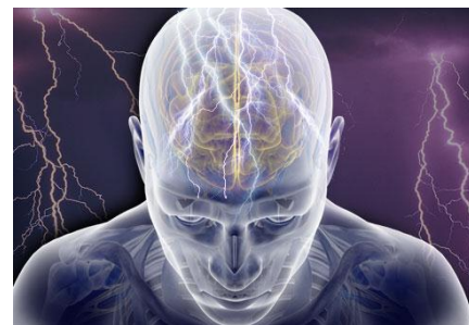
۵. ضد تشنج ها: