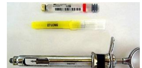
۲. بیحسی کننده:

داروهای مخدر شامل مورفین-پتدین-پنتازوسین