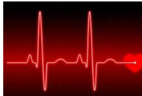
۴. ضد آریتمی ها:

مالوکس-مایلاتا-آلومینیوم هیدروکساید-منیزیم هیدروکساید