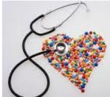
۶. ضد فشار خون ها: