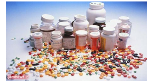
۱. مسکن ها:

برخی داروها میاستنی گراویس را تشدید می کنند. از این رو باید به هنگام استفاده از این دارو ها با پزشک خود مشورت کند. داروهایی که منع استفاده در این بیماری دارد شامل موارد زیر میباشد: